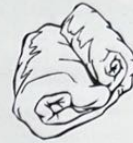
1 * Schloss