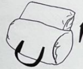
1. Nehmen Sie das Produkt aus der Tragetasche